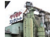
栗本コンクリート工業(株)