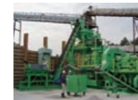
オーロラマックス