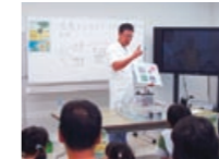
「神戸エコスクール」に参加