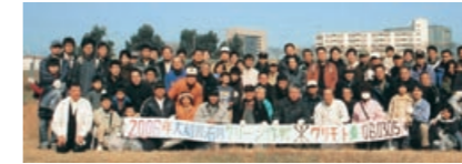
大和川・石川クリーン作戦