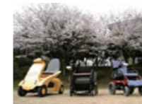
燃料電池電動車いす・カート

主要財務データ&取扱商品一覧(単体) 23 ライフライン製品 24 技術開発への取り組み 25 SPOTLIGHT 27 クリモトのネットワーク 29