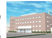
クリモト創造技術研究所