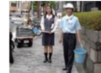
大阪打ち水大作戦

地域・社会への貢献活動 7 対外コミュニケーション活動 9 人事・教育体制 11 労働安全衛生体制 13 品質管理体制 15