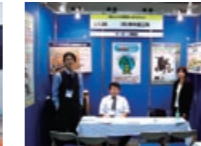
「リクナビLIVE in 東京」に参加