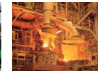
加賀屋工場のキューボラ