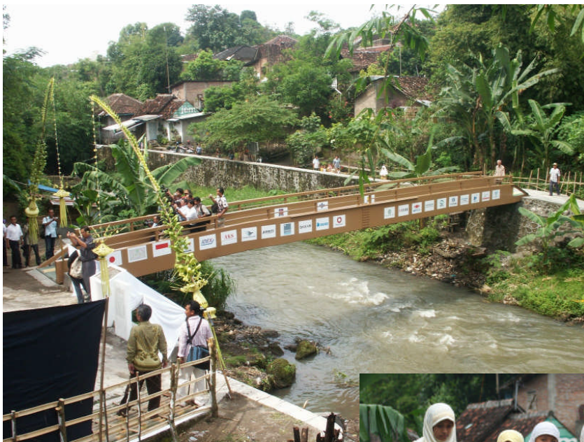
●橋を利用する住民のみなさん