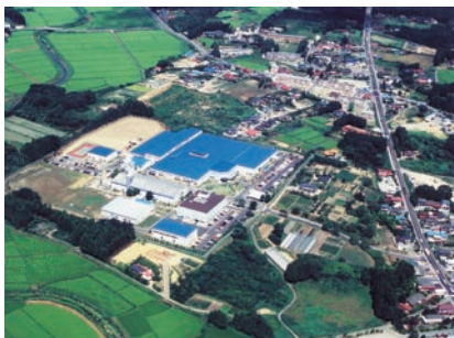
図1 本山製作所 全景