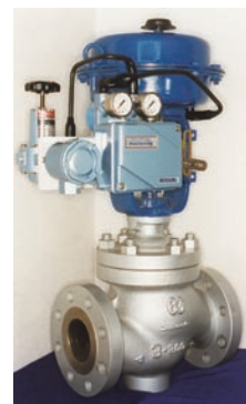
図7 グローブ形調整弁

2007年2月1日、株式会社本山製作所が当社の100%子会社としてスタートしました。当社のM&A案件としては最大の規模であり、バルブ事業の成長と発展に寄与することは、もちろんのこと、クリモトグループ全体にも大きな貢献を果たすことは間違いありません。