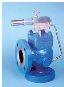
図6 パイロット式安全弁