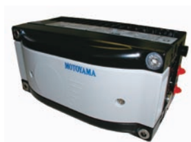
図2 多機能ポジショナー