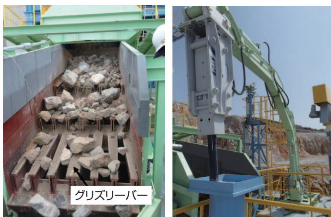
図4 グリズリースクリーン 図5 ラクロック (石割機)

塊として分別されコンベヤで輸送されます。一方で、グリズリーバーの間隙よりも大きく落下しなかった石灰石は、ジョークラッシャに送られ破碎されます。