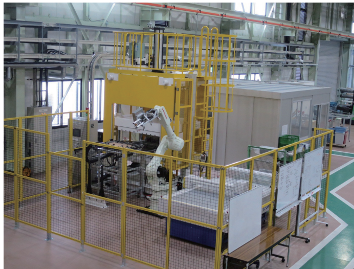
図 4 プリフォームライン