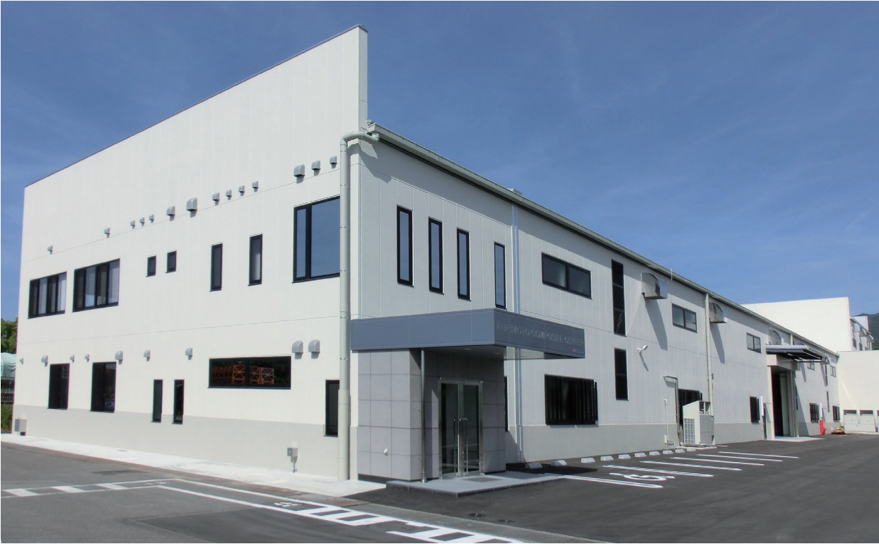
図 6 コンポジットセンター新建屋