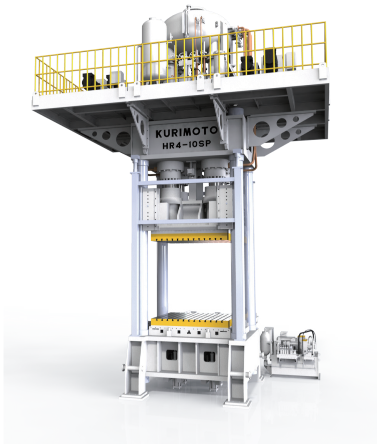
図5 大型成形機（開発中）